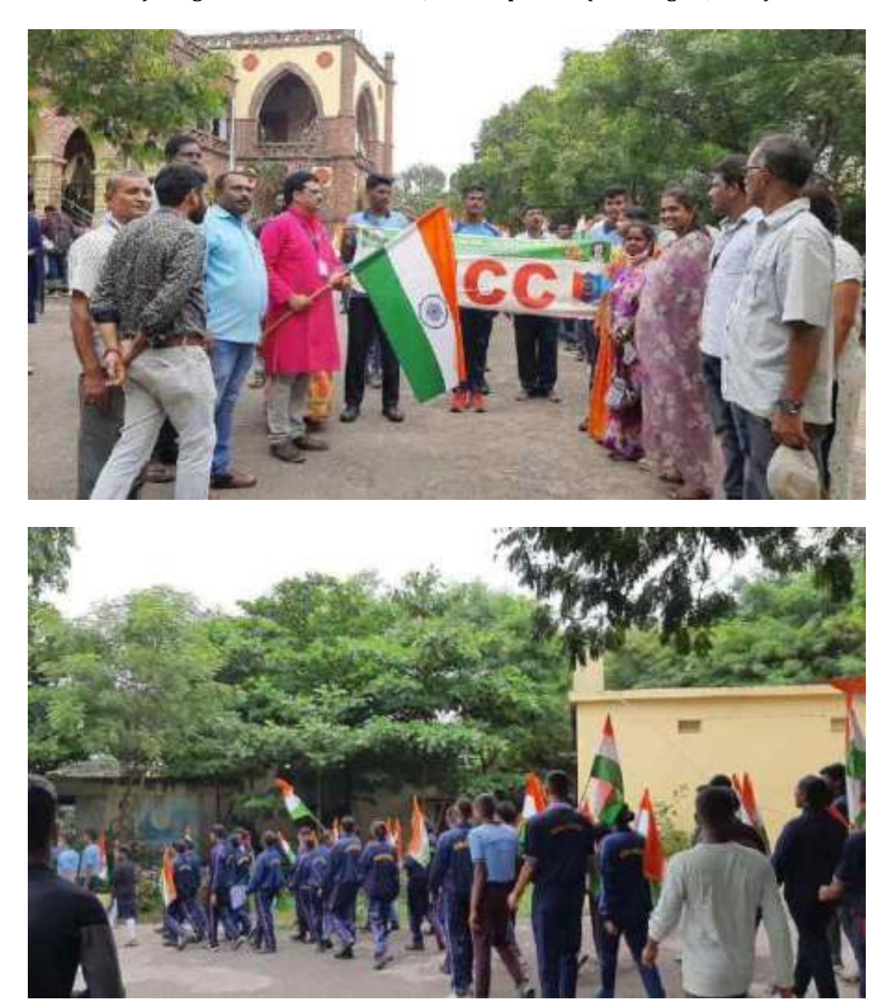
3) Flag run at town kotha road, Visakhapatnam (13th August, 2022)